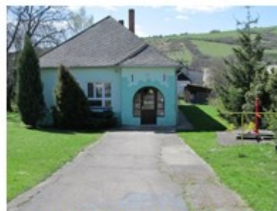
Materská škola

Na základe analýzy doterajšieho vývoja možno očakávať, že rozvoj vzdelávania sa bude orientovať na individuálny prístup k deťom primárneho vzdelávania s cieľom podpory ich osobnosti a rozvoja.