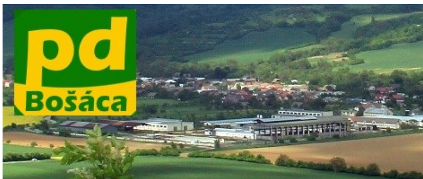
Areál Poľnohospodárskeho družstva Bošáca

Potravinársky priemysel je zastúpená firmou: