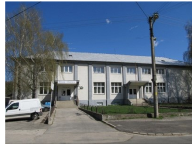
Kultúrny dom, zdroj: vlastné

V obci pôsobí niekoľko organizácií, ktoré svojou činnosťou zveľaďujú kultúrno-spoločenské dianie v obci.