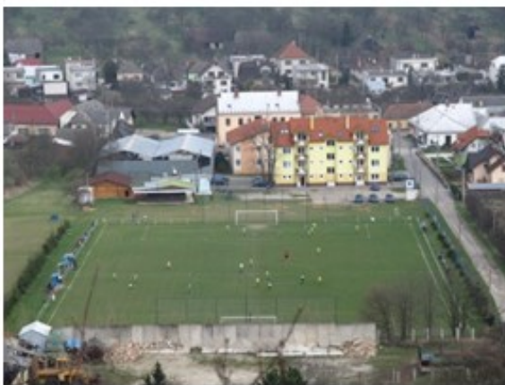
Futbalové ihrisko v Bošáci