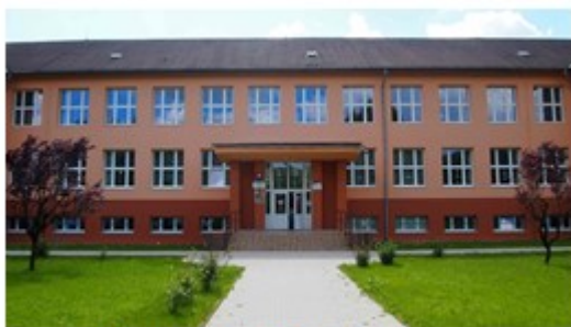
Základná škola

Základná škola s materskou školou E.V.Riznera v Bošáci a Základná umelecká škola Bošáca hospodária s vlastnými finančnými prostriedkami a je napojená na rozpočet obce.