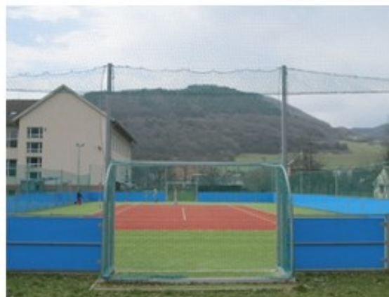
Multifunkčné ihrisko v Bošáci