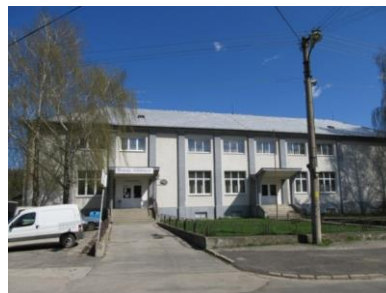
Kultúrny dom

V obci pôsobí niekoľko organizácií, ktoré svojou činnosťou zveľaďujú kultúrno-spoločenské dianie v obci. Sú nimi napr.: