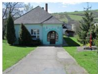
Materská škola, Zdroj: vlastné

Na základe analýzy doterajšieho vývoja možno očakávať, že rozvoj vzdelávania sa bude orientovať na individuálny prístup k deťom primárneho vzdelávania s cieľom podpory ich osobnosti a rozvoja.