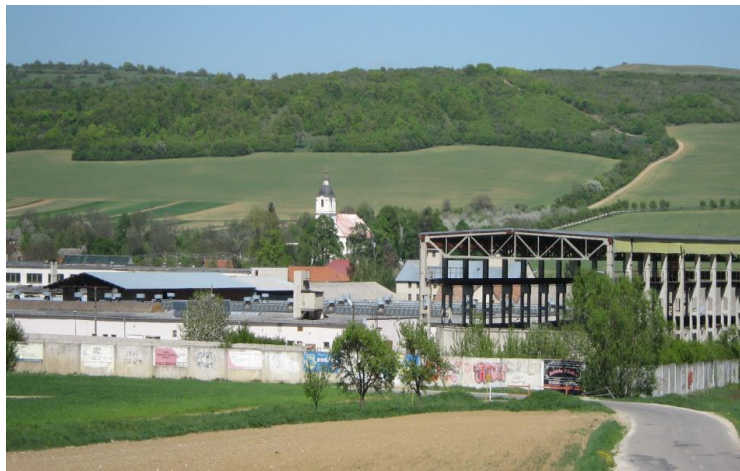
Areál Poľnohospodárskeho družstva Bošáca

Potravinársky priemysel je zastúpená firmou: