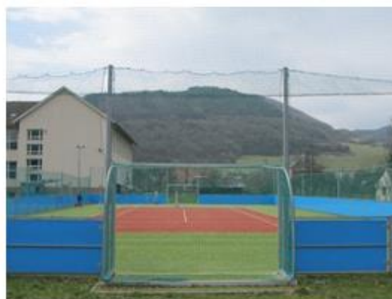
Multifunkčné ihrisko v Bošáci