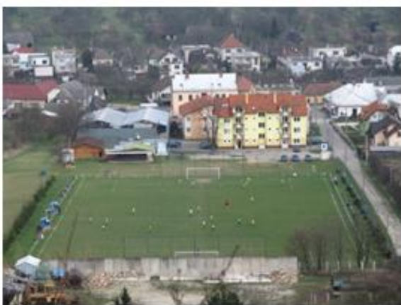
Futbalové ihrisko v Bošáci

Zo športových zariadení sa v obci nachádza futbalové ihrisko a multifunkčné ihrisko. V roku 1925 a 1926, boli postavené budovy Orolne a Sokolovne. Obe boli vybavené telocvičným náradím. Už predtým v roku 1920 však svoju činnosť začala Telocvičná jednota Sokol. S jej vznikom sa v Bošáci začína rozvíjať stolný tenis, volejbal, ale najmä futbal. Po 2. sv. vojne bolo v obci vybudované futbalové ihrisko. Pri budove Sokolovne bolo postavené volejbalové ihrisko, ktoré bolo koncom osemdesiatich rokov 20. storočia rozšírené o tenisový kurt, ktorý je už zničený a jeho plocha sa tiež v zimných mesiacoch využívala ako klzisko. V roku 2019 bol v areáli Sokolovne vybudovaný amfiteáter, ktorý sa v súčasnej dobe využíva na kultúrne predstavenia.