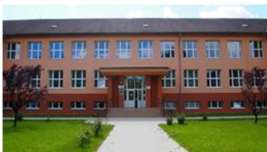
Základná škola

Základná škola s materskou školou L.V.Riznera v Bošáci hospodári s vlastnými finančnými prostriedkami a je napojená na rozpočet obce.