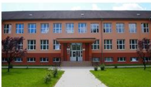
Základná škola