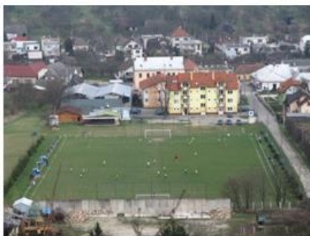
Futbalové ihrisko v Bošáci

futbalové ihrisko. Pri budove Sokolovne bolo postavené volejbalové ihrisko, ktoré bolo koncom osemdesiatich rokov 20. storočia rozšírené o tenisový kurt. V súčasnej dobe je tenisový kurt zničený a jeho plocha sa v zimných mesiacoch využíva ako klzisko.