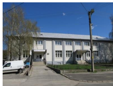
Kultúrny dom

V obci pôsobí niekoľko organizácií, ktoré svojou činnosťou zveľaďujú kultúrno-spoločenské dianie v obci. Sú nimi napr.: