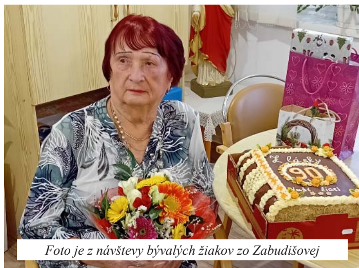
Foto je z návštevy bývalých žiakov zo Zabudšovej