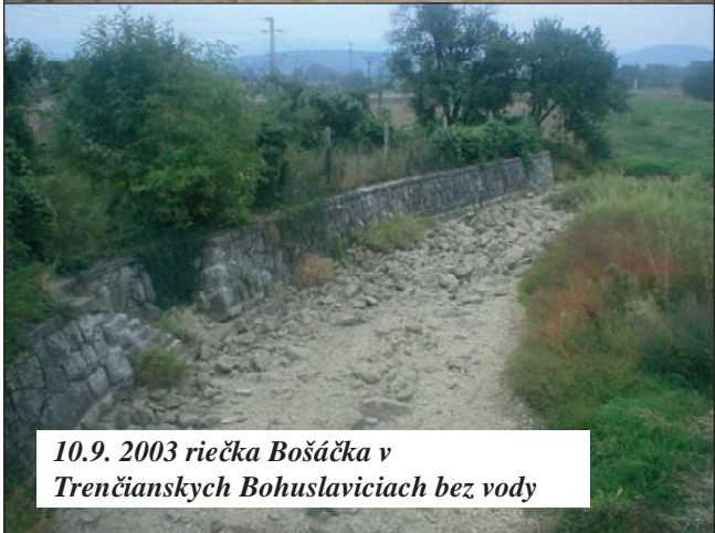
10.9. 2003 riečka Bošáčka v Trenčianskych Bohuslaviciach bez vody