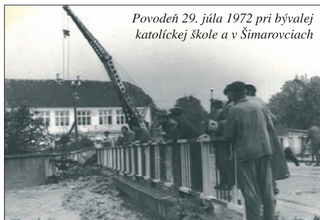
Povodeň 29. júla 1972 pri bývalej katolíckej škole a v Šimarovciach

Na druhej strane, dlhotrvajúce suchu a absencia