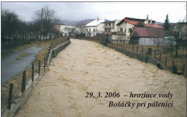
29. 3. 2006 – hroziace vody Bošáčky pri pálenici

A ešte raz povodeň v Bošáci v roku 1972 – keď nestačilo koryto potoka, voda „využívala“ aj cesty.